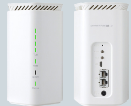
Speed Wi-Fi HOME 5G L12